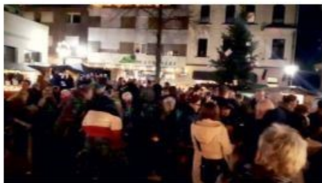
Allerlei los auf dem Lindenplatz.

Die Mitwirkenden der Vereine haben sich richtig „ins Zeug gelegt“ und das Interesse der Wickrather an der Veranstaltung war groß. Deshalb wird es im Veranstaltungskalender 2020 am 5. Dezember 2020 ab 15 Uhr wieder ein Adventsfest auf dem Lindenplatz geben. Übrigens ist der Heimat- und Verkehrsverein nun Eigentümer der Weihnachtsbeleuchtung auf der Quadtstraße und von fünf Holzbuden, somit sind schon wieder einige Dinge für die Zukunft geregelt.