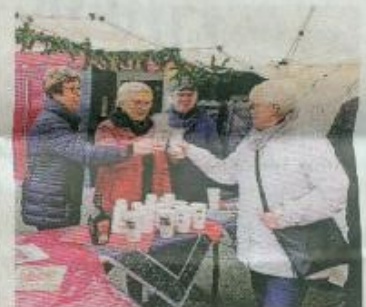
Die Vereine stemmten einen wunderschönen Weihnachtsmarkt.

Wer noch Geschenke für das nahe Weihnachtsfest benötigte, konnte sich beim Heimatverein und beim Netzwerk 55+ einkaufen. Der Erlös des Marktes soll der Jugendarbeit in Wickrath zugutekommen. Die Veranstaltung war nicht die erste Aktion der Wickrather Vereine in diesem Jahr. Sie haben schon das Realschulfest mitgestaltet und ein Vereinsfest für Wickrather Vereinsmitglieder auf die Beine gestellt.